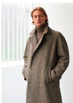
De Bonne Facture Manteau croisé