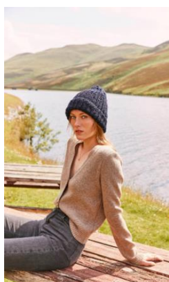
Balzac Paris Cardigan Hilda