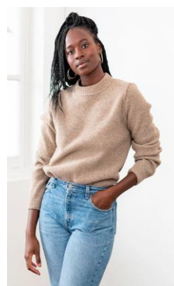
Le Slip Français Pullover Ludo