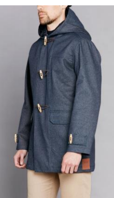
Atelier Tuffery Aigoual

# EN 2 ANS, CE SONT UNE VINGTAINÉ DE MARQUES QUI ONT MIS EN COLLECTION DES LAINES FRANÇAISES, SOIT PLUS DE 20 TONNES DE LAINES BRUTES QUI ONT ÉTÉ TRANSFORMÉES