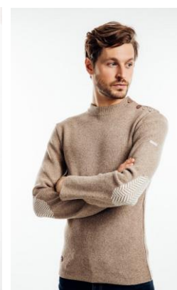
Saint James X Le Slip Français