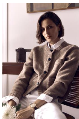
Devernois Veste Vogue